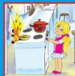
Газовые и электроплиты