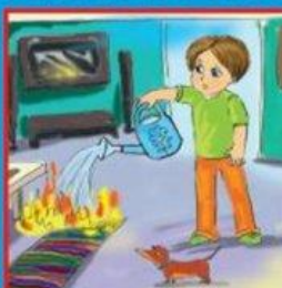
Мелкое возгорание потушить подручными средствами