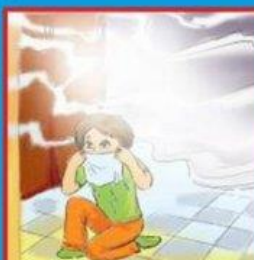
В задымленном помещении дышать через мокрую ткань