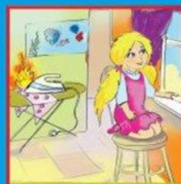
Оставленные без присмотра электроприборы