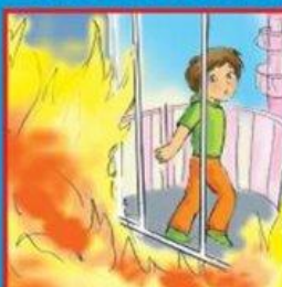
Если выйти невозможно, найти источник свежего воздуха, выбраться на балкон