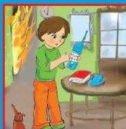
Вызвать пожарных по телефону 01