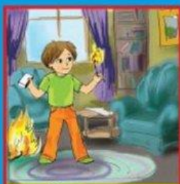
Неосторожное обращение с огнем