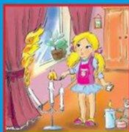
Игры с огнем